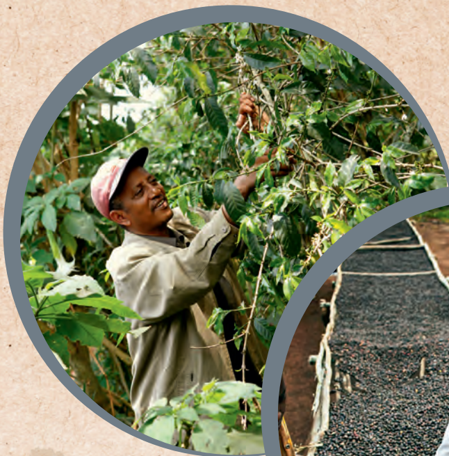
Im Regenwald wild gewachsen und handgepflückt