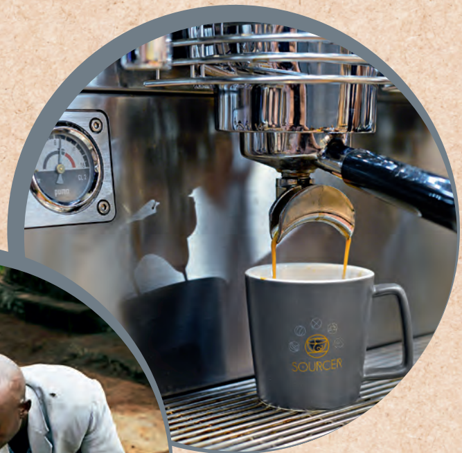
Einzigartig im Geschmack