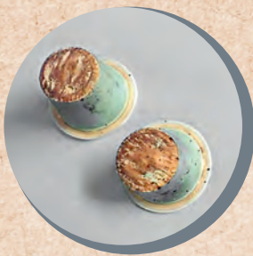
nach der Benutzung

Nachhaltigkeit ist für SOURCER WILD ein essenzieller Bestandteil des Konzeptes. Deshalb sind unsere Nespresso-kompatiblen Kaffeekapseln heimkompostierbar. Sie enthalten weder Aluminium noch fossile Stoffe und innerhalb von sechs Monaten auf dem heimischen Kompost sind bereits mindestens 90 Prozent des Materials zersetzt. Aufgrund seiner einzigartigen Aromabarriere schmeckt der Kaffee immer gleich frisch. Die Kapseln sind die ideale nachhaltige Ergänzung für Hotels.