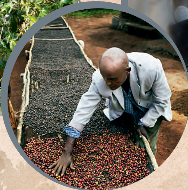
Vier bis acht Wochen sonnengetrocknet und schonend trommelgeröstet