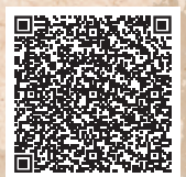
Alle SOURCER WILD Artikel hier im Überblick.